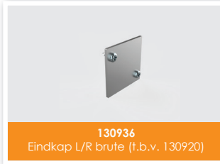
130936 Eindkap L/R brute (t.b.v. 130920)