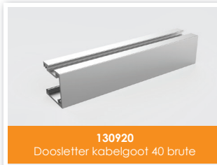
130920 Doosletter kabelgoot 40 brute