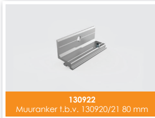
130922 Muuranker t.b.v. 130920/21 80 mm