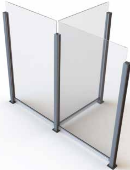
Terrace 75 dwarsdoorsnede